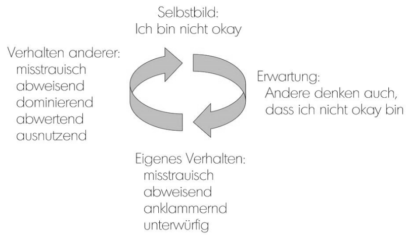
Abbildung 1: Selbstbildteufelskreis I